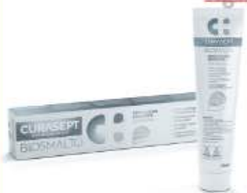
CURASEPT BIOSMALTO Protezione erosione dentifricio 75 ml

CONTINUA LA PROMOZIONE DI MARZO VALIDA FINO AL 30 APRILE 2026