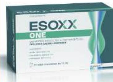
ESOXX ONE 20 stick monodose da 10 ml