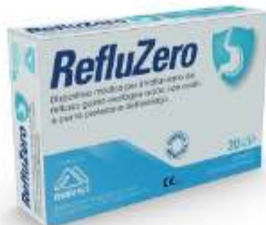
REFLUZERO 20 compresse