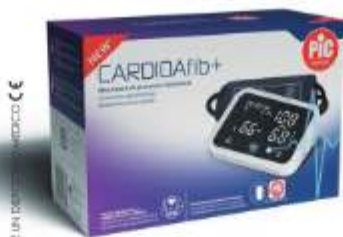
CARDIOFIB+ MISURATORE DI PRESSIONE DA BRACCIO