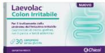
LAEVLAC COLON IRRITABILE 30 compresse