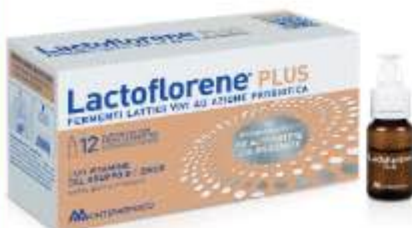
LACTOFLORENE PLUS 12 flaconcini

CONTINUA LA PROMOZIONE DI MARZO VALIDA FINO AL 30 APRILE 2026