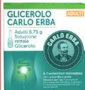
GLICEROLO CARLO ERBA ADULTI 6,75 g Soluzione rettale 6 contenitori monodose con camomilla e malva