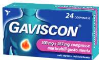
GAVISCON 500 mg + 267 mg 24 compresse gusto menta