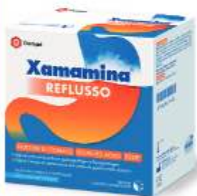
XAMAMINA REFLUSSO 25 bustine da 20 ml gusto uva fregola e frutti rossi