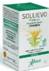
SOLLIEVO FISIOLAX 90 compresse