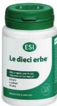
LE DIECE ERBE 100 tavolette