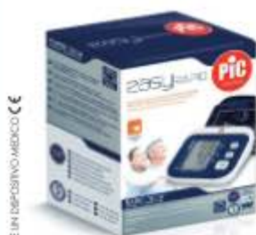
EASYPRESS MISURATORE DI PRESSIONE AUTOMATICO DIGITALE